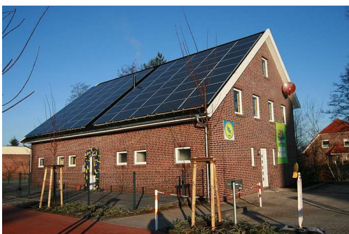
Unser Vereinsheim an der Kirchstraße 4a